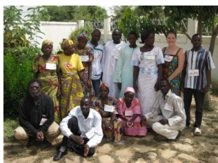
Le Equipe des Pair Educateurs

« Le pair éducateur à pour mission de sensibiliser, d'éduquer, d'écouter ou de redonner des informations ou des capacités reçus à ses membre des sa communauté »